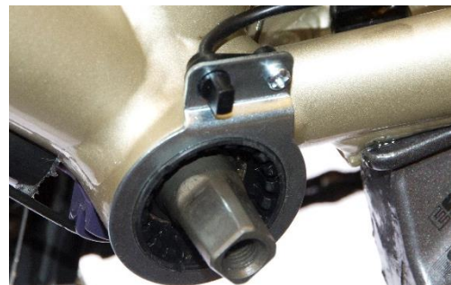
Foto 3.1 Achter lagercup