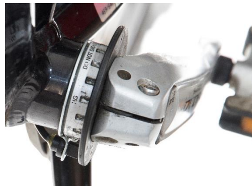
Foto 3.4 Hollowtech II

Ter compensatie van de dikte van houder + magneetschijf moeten 2 vulringen (meestal aanwezig) worden weggenomen. Zit er maar een zwarte kunststof opvulring aan de linkerzijde, dan kijken of ook bij de rechter cup een opvulring weggenomen kan worden (dit kan een probleem opleveren bij het afstellen van de voor derailleur)