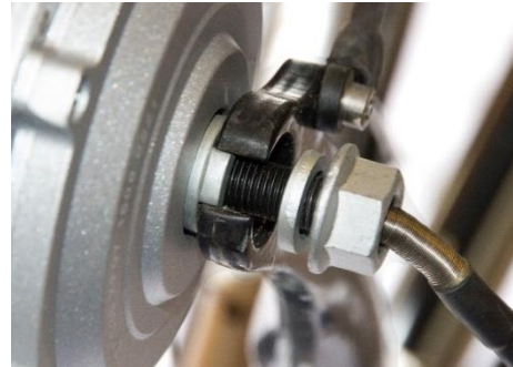
Foto 1.1 Velgrem

Na montage dienen de remblokken op de nieuwe velg te worden afgesteld, zodat het wiel vrij kan ronddraaien en een goede remmende werking ontstaat.