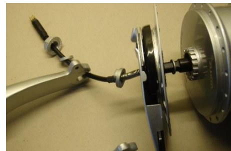
Foto 1.3 Rollerbrake